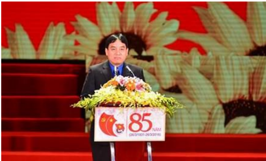
Đồng chí Nguyễn Đắc Vinh, Ủy viên BCH T.Ư Đảng, Bí thư thứ nhất T.Ư Đoàn phát biểu khai mạc buổi lễ

Ngay từ những ngày đầu thành lập Đảng, đấu tranh giành chính quyền, Bác Hồ và Đảng ta đã coi trọng việc xây dựng tổ chức Đoàn thanh niên để tập hợp, đoàn kết thanh niên phấn đấu vì mục tiêu lý tưởng của Đảng và dân tộc.